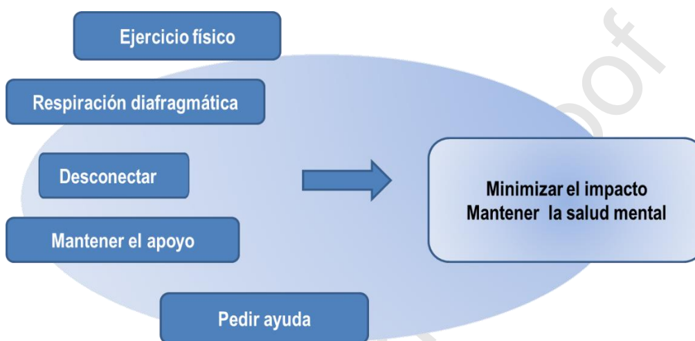
Figura 1. Recomendaciones finales para afrontar el impacto emocional 22-32

A la luz de lo comentado hasta este momento queda patente la necesidad específica de intentar minimizar el impacto emocional de la epidemia en los trabajadores de la salud. Los mecanismos mencionados que han servido a otros profesionales, y que son imprescindibles, como las medidas de protección, protocolos claros y efectivos, sin embargo, estas no dependen, en muchas ocasiones, de la capacidad de los profesionales. Por ello, se sugieren, a continuación, recomendaciones dirigidas a la prioridad personal de mantener la salud mental (figura 1).